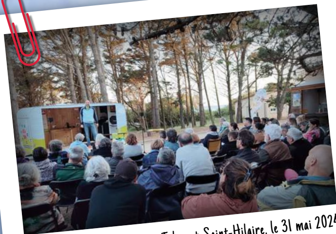
UCR Conférence gesticulée à Talmont-Saint-Hilaire, le 31 mai 2024

Rendez-vous en 2025 pour une nouvelle UCR autour des transitions écologique, sociale et démocratique !