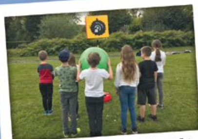
« Poull ball » - Arc-en-Barrois, Grand-Est