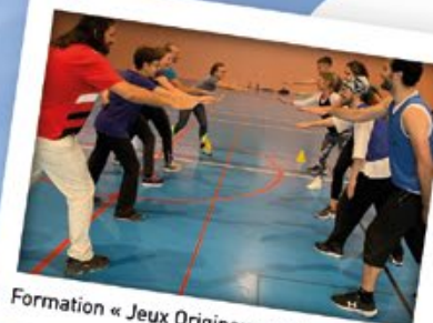
Formation « Jeux Originaux », Haute-Marne

Comment, sur la base de nos réflexions, se positionne-t-on sur les enjeux de pratiques sportives ? Construction du plaidoyer sport rural vers 2046 !