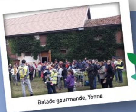
Balade gourmande, Yonne