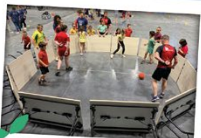
« Gaga ball » - Terre de jeux - Chaumont